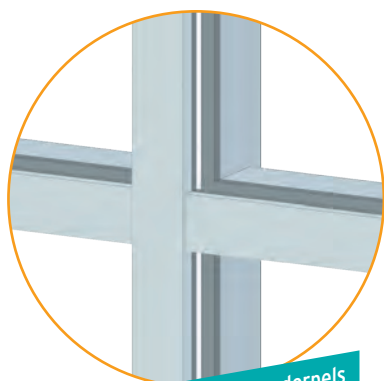
Koppeling van stijlen en dorpels